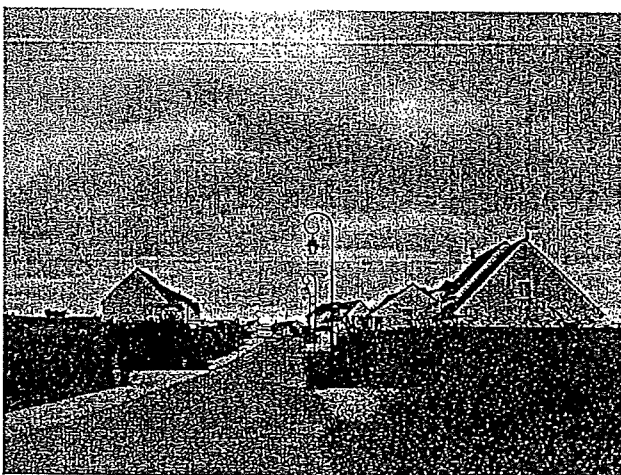
Rue de la Haubette