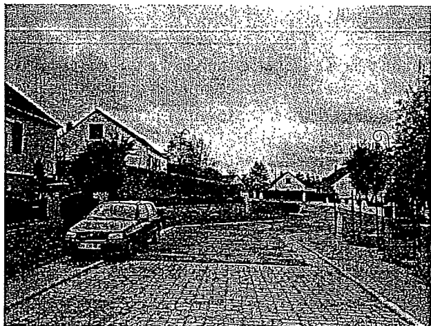
Rue André Lelarge