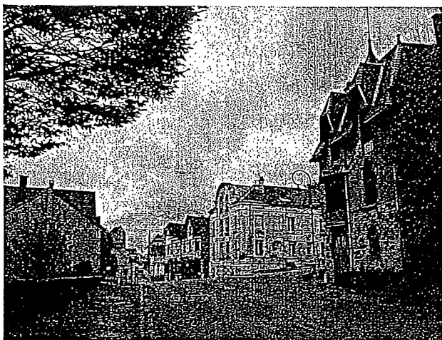
Rue Charles de Gaulle