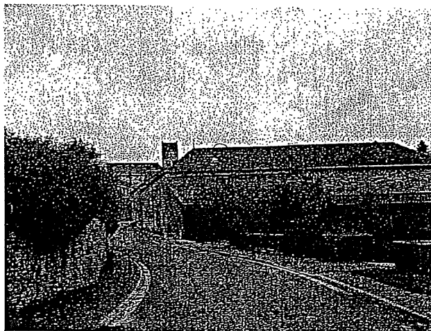
Rue de Jonquery