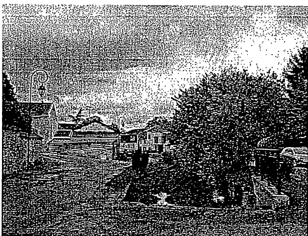
Rue d'en bas